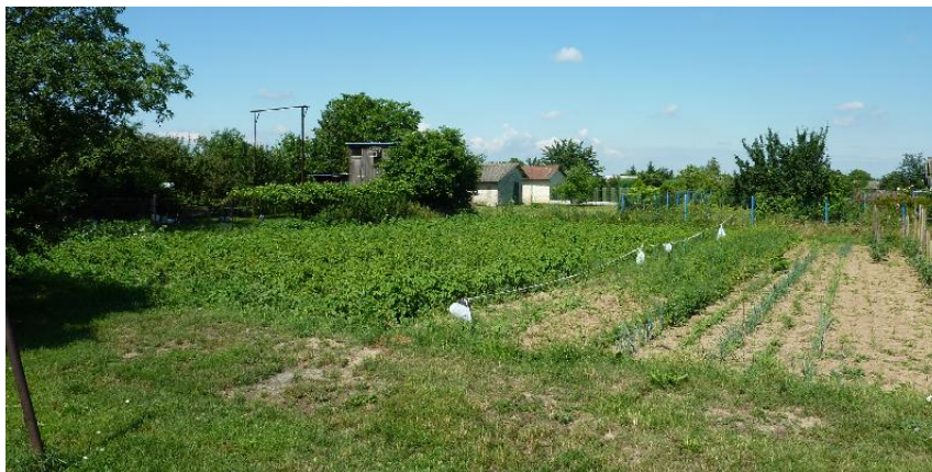
Ogrody działkowe w obszarze objętym planem.

Obszar objęty planem jak wyżej wskazano obejmuje przede wszystkim grunty rolne zagospodarowane ogrodami działkowymi. W części przylegającej do drogi krajowej nr 35 o powierzchni ok. 1,8 ha prowadzona jest gospodarka rolna. Grunty te posiadają zgodę na zmianę przeznaczenia gruntów rolnych na cele nierolnicze i nieleśne.