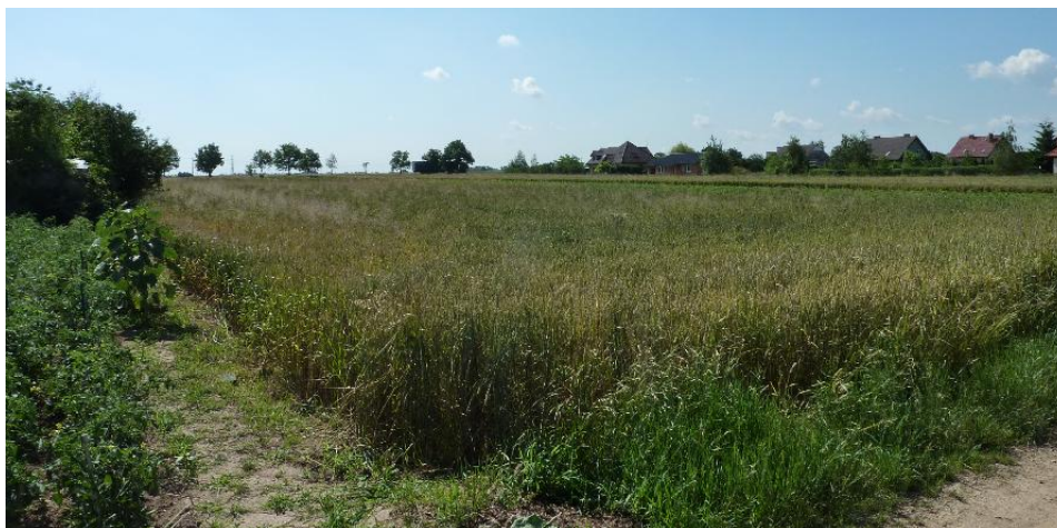
Uprawy rolne. Fragment obszaru planu przylegający do dk35. Widok od strony ul. Spokojnej.