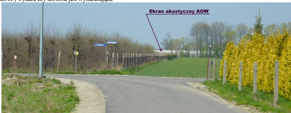
Skrzyżowanie ulic Agrestowej i Morelowej, w tle ekran akustyczny na AOW. (fot. P. Jędrzejkowski)

W związku z bliskością dróg wojewódzkich oraz AOW, mieszkańcy nowych budynków mogą być narażeni na hałas komunikacyjny. Jednakże przy AOW od strony wsi Mokronos Dolny znajdują się ekrany akustyczne, a analiza porealizacyjna (jesień br.) wykaże czy ich ilość jest wystarczająca.