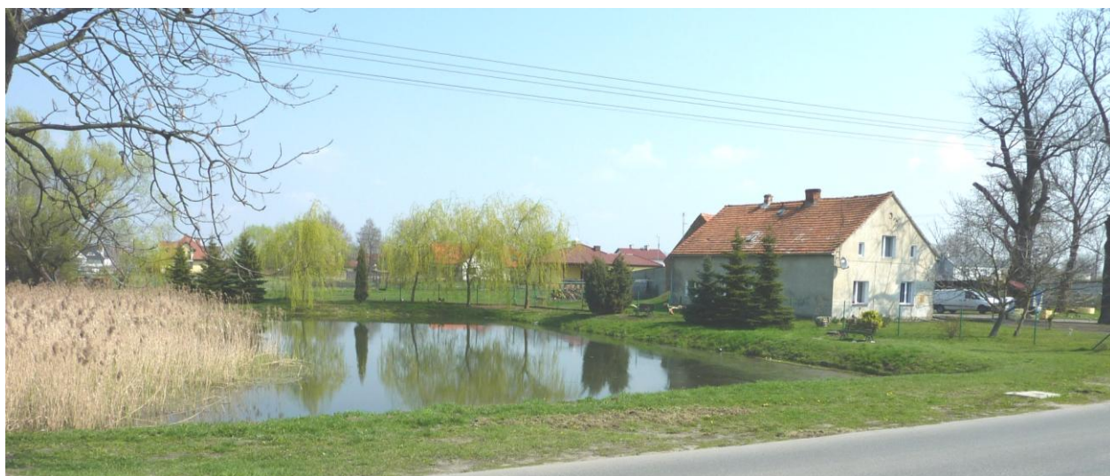
Teren WS.6 - istniejący staw.

W tekście planu na tych obszarach dopuszcza się umieszczenie urządzeń technicznych, zieleni, sieci infrastruktury technicznej, obiektów małej architektury i nośników reklamowych, nie kolidujących z przeznaczeniem terenu i zgodnie z przepisami odrębnymi. Natomiast wprowadzono tu zakaz lokalizacji tymczasowych obiektów usługowo – handlowych.