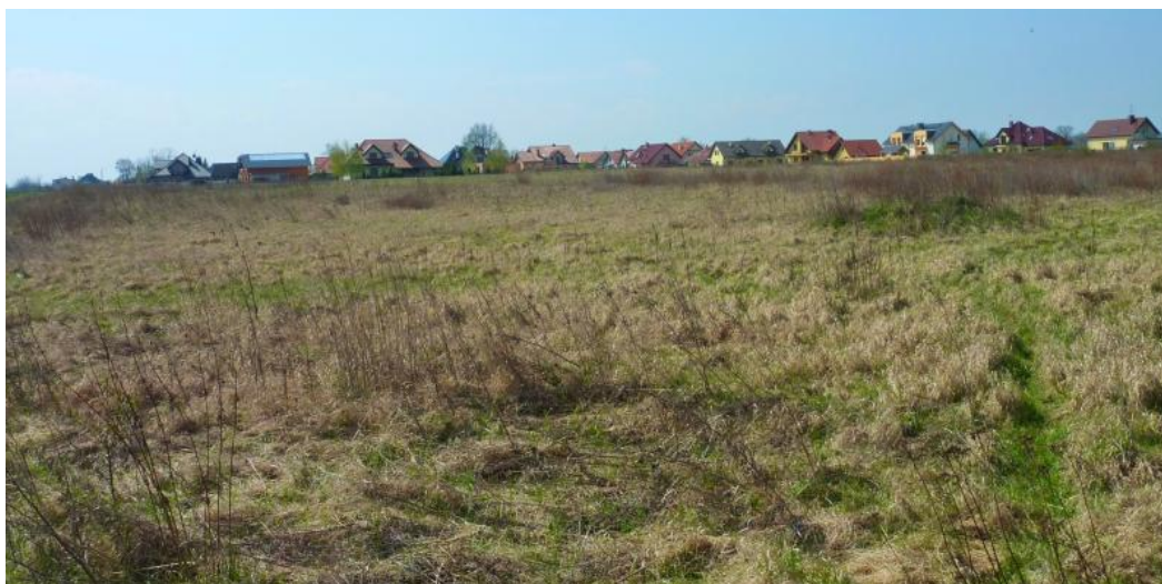
Widok na obszar objęty planem od strony północnej..

Bezpośrednio na terenie objętym opracowaniem brak cieków wodnych, utwardzonych dróg i zabudowy kubaturowej.