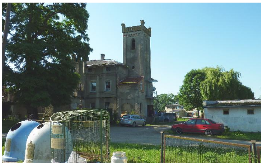
Pałac w Rybnicy

Ponadto z uwagi na walory historyczne, centralna część wsi wraz z pałacem objęta jest strefą ochrony konserwatorskiej – krajobrazu kulturowego. Dodatkowo z uwagi na zinwentaryzowane stanowiska archeologiczne (17/70/81-27 AZP osada ludności kultury łużyckiej z epoki brązu i okresu halsztackiego oraz 18/71/81-27 AZP osada ludności kultury łużyckiej z epoki brązu i okresu halsztackiego) i średniowieczną metrykę wsi Rybnica cały obszar planu objęty została strefą ochrony konserwatorskiej – zabytków archeologicznych.