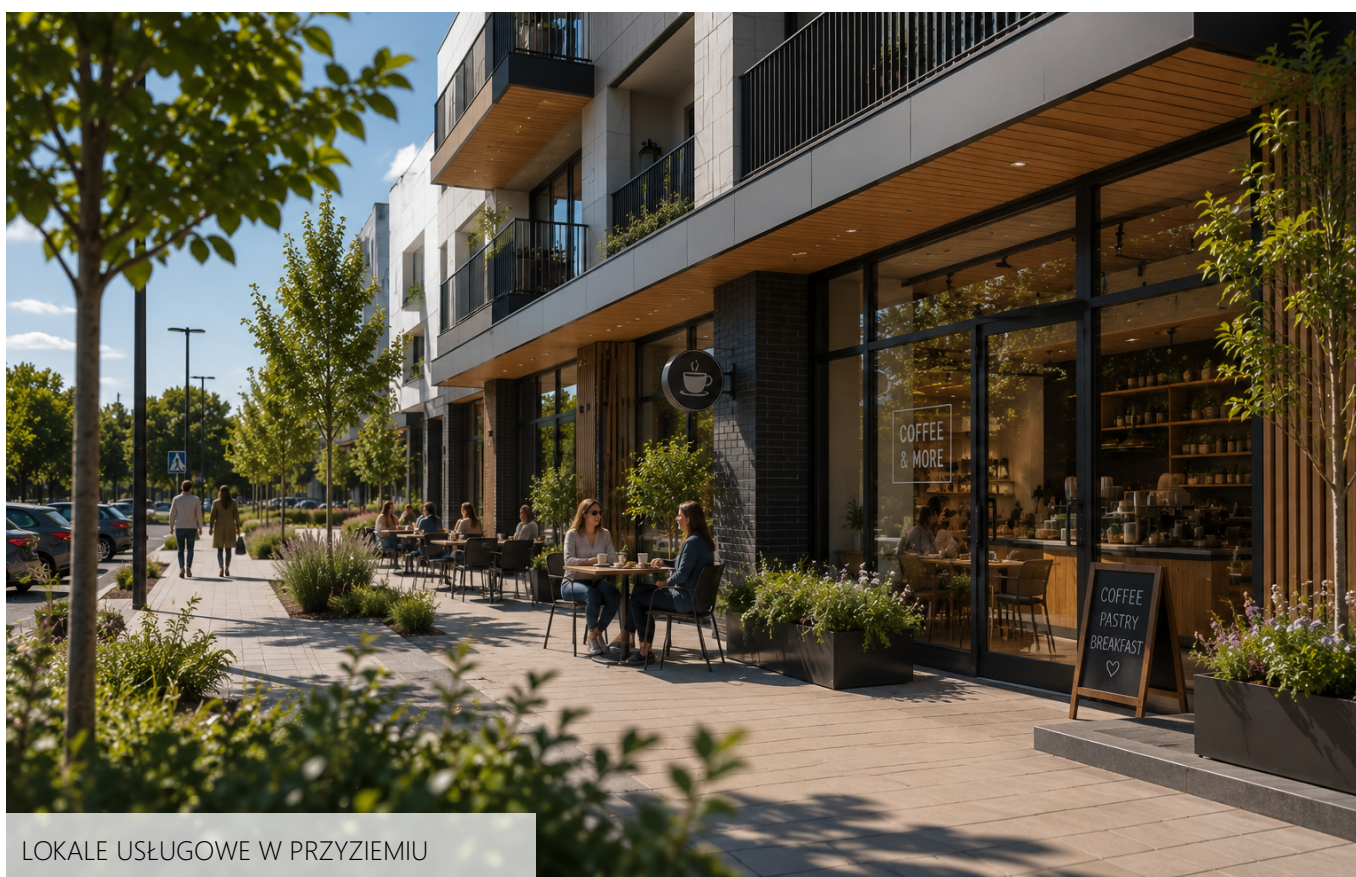
LOKALE USŁUGOWE W PRZYZIEMIU