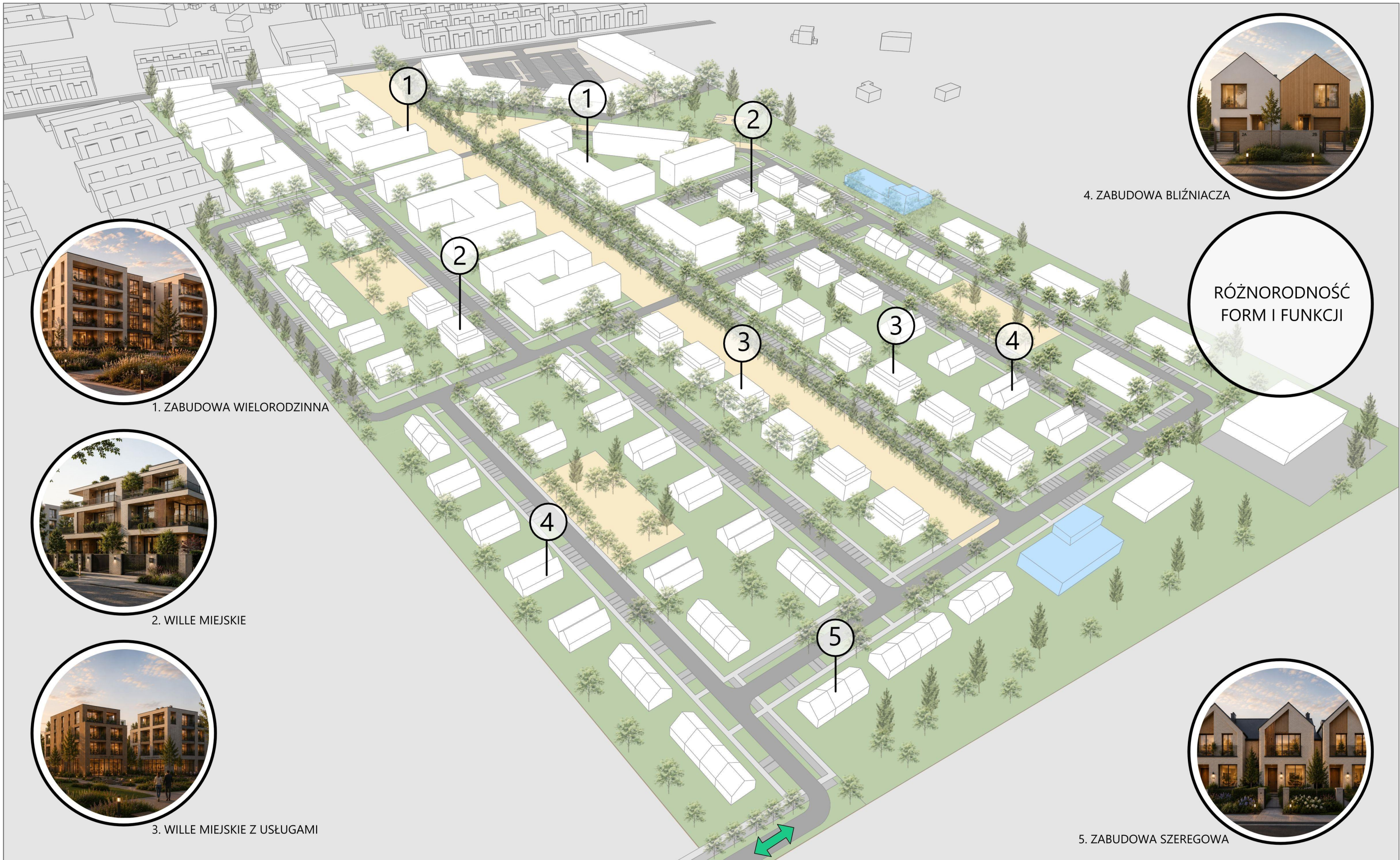
1. ZABUDOWA WIELORODZINNA