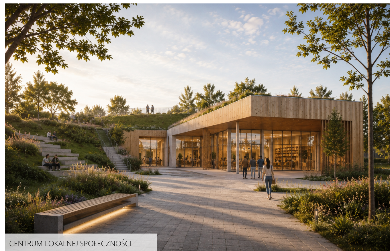
CENTRUM LOKALNEJ SPOŁECZNOŚCI