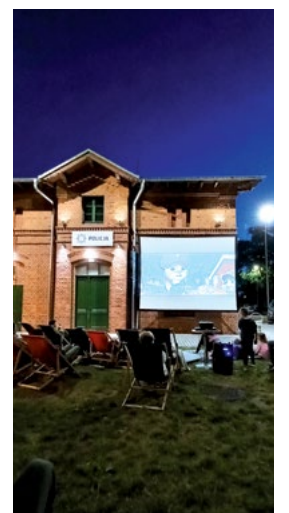
Film Zwierzogród

W ciepły, piątkowy wieczór - 5 lipca, na skwerze przy GOKiS w Smolcu odbyło się spotkanie z cyklu Familijnego Kina Dworcowego. Tym razem na wielkim ekranie wyświetlono uwielbianą przez dzieci i dorosłych animację „Zwierzogród”. To plenerowe wydarzenie przyciągnęło mieszkańców Smolca i okolic, którzy licznie zgromadzili się, by wspólnie spędzić czas w miłej atmosferze. Podczas seansu widzowie nie tylko mogli cieszyć się filmem, ale również zająć przekąskami, które zostały dla nich przygotowane. Kolejne pokazy już wkrótce.