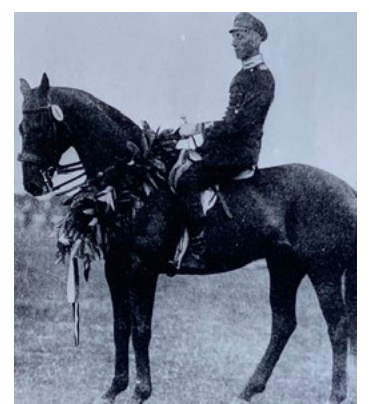
Wyścigi w Sadowicach