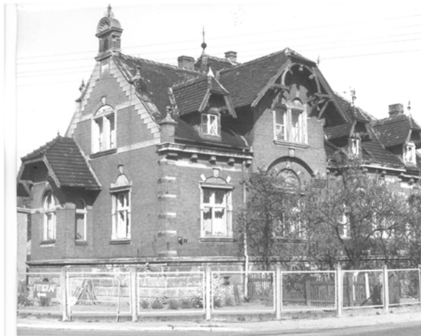
Willa w latach 1985-1987 - wówczas adres przy ul. Marksa

Są opinie, że budynek powstał jako rezydencja miejska wzniesiona przez fabrykanta wolnomularza jako budynek mieszkalny w stylu neogotyckim modnym w okresie romantyzmu. Budynek jest też podobny do innych willi między innymi w Karpaczu. Niestety nie zachowało się żadne nazwisko właściciela domu, być może związany był z sąsiednim młynem. Willa posiadała także piękne i wiel-