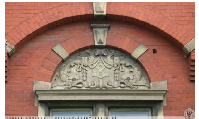
Detale architektoniczne willi