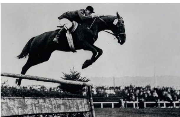
Wyścigi w Sadowicach