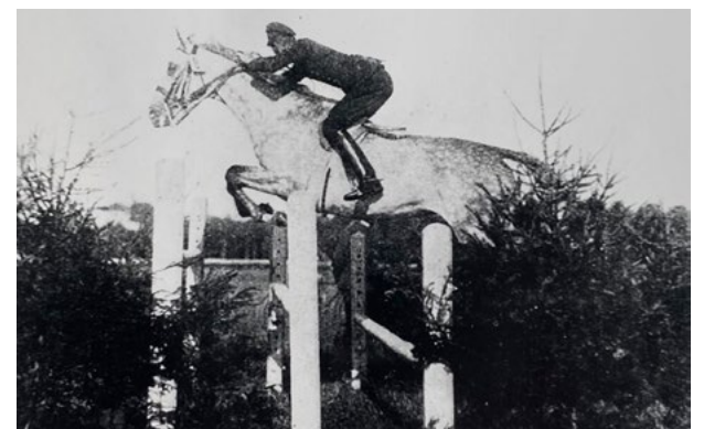
Wyścigi w Sadowicach