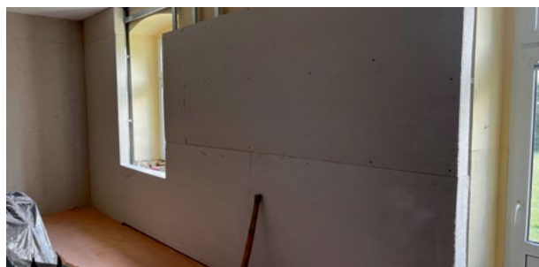
SP Małkowice - sala lekcyjna w trakcie ocieplania

W lipcu ruszyły prace związane z termomodernizacją budynku Szkoły Podstawowej w Małkowicach przy ul. Szkolnej 4. Zadanie obejmuje wykonanie termomodernizacji od wewnątrz budynku (ocieplenie ścian zewnętrznych, stropu poddasza i dachu) i wymianę istniejącej stolarki drzwiowej wewnętrznej na poddaszu. W zakresie branży elektrycznej zostanie zrealizowany montaż odnawialnego źródła energii elektrycznej - układu paneli fotowoltaicznych o mocy zainstalowanej 18,70 kW na systemowych naziemnych konstrukcjach nośnych, montaż instalacji odgromowej i ogrodzenia instalacji. W zakresie branży sanitarnej zostanie zrealizowana modernizacja systemu zasilania budynku w ciepło z wykorzystaniem odnawialnych źródeł energii z częściową modernizacją instalacji przez montaż pompy ciepła powietrze/woda, modernizacja instalacji c.o. wraz z regulacją hydrauliczną. Wykonawca robót zobowiązany