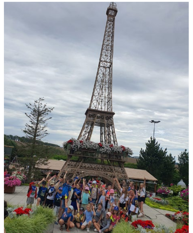
Wycieczka do minieurolandy

Nie zabrakło też aktywności sportowych i integracyjnych, które umożliwiały dzieciom nawiązywanie nowych znajomości i rozwijanie umiejętności pracy w grupie. Każdy turnus obfitował w pełne emocje wycieczki całodniowe. Wśród nich znalazły się warsztaty zielarskie na Zielonym Wulkanie w górach Kaczawskich, dzień na plantacji lawendy La-