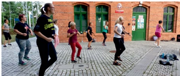
Wakacyjne poruszenie - zumba maxifot. GOKiS Smolec