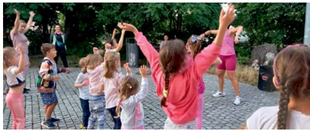
Wakacyjne poruszenie - zumba mini

W każdą wakacyjną środę mieszkańcy Smolca mają okazję wziąć udział w energetycznych zajęciach zumbi. Dotychczas odbyło się już kilka zajęć, które cieszyły się dużym zainteresowaniem. Zajęcia są podzielone na dwie części: o 19.30 zaczyna się „Zumba Mini” dla dzieci, a o 20.00 rozpoczyna się pełnowymiarowa zumba dla dorosłych. To świetna okazja, by połączyć aktywność fizyczną z dobrą zabawą, a wszystko to w atmosferze tańca, muzyki i świeżego powietrza. Co ważne, udział w zajęciach jest całkowicie bezpłatny, dzięki czemu każdy może spróbować swoich sił. Zapraszamy na kolejne spotkania, które będą odbywały się przez cały sierpień. Dołączcie do nas, by aktywnie spędzić wakacyjne wieczory i naładować się pozytywną energią!