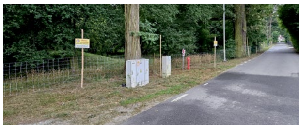
Rewitalizacja parku w Smolcu

Z końcem lipca zawarta została umowa na wykonanie robót budowlanych w ramach realizacji projektu pn. „Odnowa przestrzeni publicznej w celu stworzenia miejsc do wypoczynku i rekreacji na terenie gminy Kąty Wrocławskie w tym poprzez rewitalizację parku gminnego w Smolcu”. W ramach projektu zostaną wykonane ścieżki parkowe nawiązujące do ich historycznego układu parkowego, z łączącą obie strony Parku drewnianą kładką dł. ok. 680 cm.