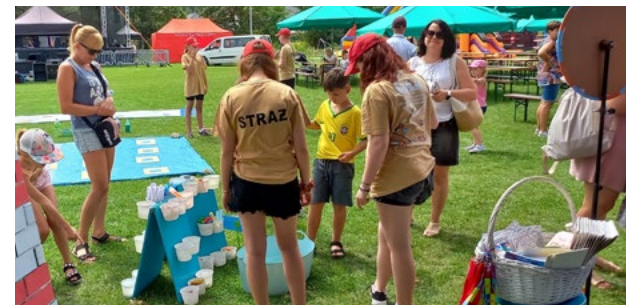
fol. GOKiS Smolec