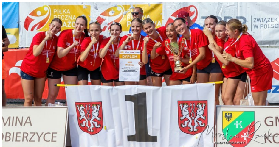
Sportowych emocji i radości nie brakowało

tastycznej atmosfery. Mistrzostwa Polski w Piłce Ręcznej Plażowej 2024 były się świetną okazją do promowania tej dynamicznie rozwijającej się dyscypliny sportu. Gratulujemy zwycięzcom i dziękujemy wszystkim uczestnikom za znakomitą postawę i sportową walkę.