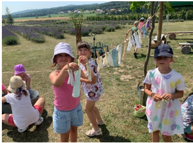
Wycieczka do plantacji lawendy

W dniach 1-26 lipca Gminny Ośrodek Kultury i Sportu w Smolcu zorganizował cztery turnusy półkolonii pod hasłem „Odjazdowe lato”. Dzieci i młodzież miały okazję uczestniczyć w niezwykle różnorodnym programie, który każdego dnia przynosił nowe wyzwania i niezapomniane wspomnienia. W programie półkolonii znalazły się między innymi zabawy tematyczne, takie jak dzień świątowy, podczas którego uczestnicy poznawali kulturę i tradycję Wietnamu, Hawajów, Egiptu oraz Brazylii. Zostało zorganizowane także wydarzenie pod hasłem „Dzień na wyobraźnię”, które przeniosło dzieci w fantastyczne światy, m.in. na Marsa, do epoki Flinstonów oraz na dwór króla Artura. Te kreatywne zajęcia pozwalały rozwijać wyobraźnię i poszerzać horyzonty uczestników.