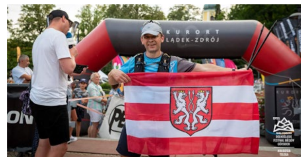
Klub Biegacza Kąty Wrocławskie

Fussen, w czasie 4:09:28. Był to jego 35 maraton. - Od 18 do 21 lipca w Łądku Zdroju odbywał się Dolnośląski Festiwal Biegów Górskich. Lidia Ostapczuk wystartowała w biegu anglosaskim „Trojak Trail” na dystansie 10 km, o podwyższeniu +/-450m i ukończyła go z czasem 1:21:51. -Łukasz Zachara wystartował w „Golden Mountains Trail” na dystansie 33km, o podwyższeniu 1600m. Pokonanie tej trasy zajęło mu 4:57:12. Serdecznie gratulujemy naszym biegaczom kolejnych sukcesów.