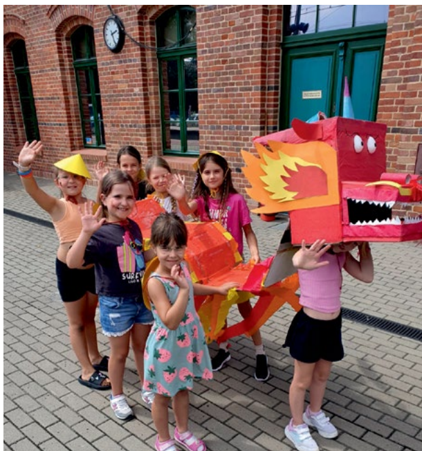
Dzjazdowe lato

Nie zabrakło też aktywności sportowych i integracyjnych, które umożliwiały dzieciom nawiązywanie nowych znajomości i rozwijanie umiejętności pracy w grupie. Każdy turnus obfitował w pełne emocje wycieczki całodniowe. Wśród nich znalazły się warsztaty zielarskie na Zielonym Wulkanie w górach Kaczawskich, dzień na plantacji lawendy La-