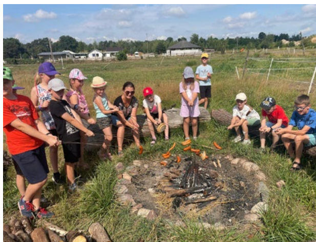
Kreatywne półkolonie

Dzieci spędzały dużo czasu na świeżym powietrzu, gdzie poznawały sposoby na aktywność poza światem wirtualnym. Dzięki Signum Polonicum Wrocław nasi koloniści mieli okazję obejrzeć pokaz stroju rycerza oraz zapoznać się z różnymi rodzajami białej broni. Nie zabrakło zabaw sprawnościowych - nabijania krążków na szable oraz niesamowitego pokazu walk rycerskich.