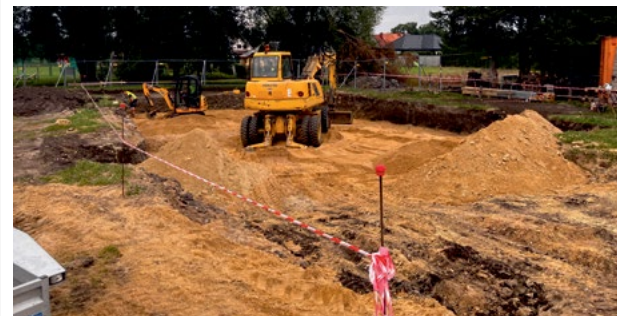
Ruszyły prace budowlane świetlicy w Krzeptowie

Kolejne ulice zyskały nowe oświetlenie drogowe. Zakończono już prace w Krzeptowie – na ulicy Jagodowej wybudowanych zostało 17 lamp, które oświetlą odcinek o długości 645 mb. Z kolei w Małkowicach pojawiły się dwie nowe lampy na ul. Szkolnej, które oświetlą odcinek o długości 100 mb.