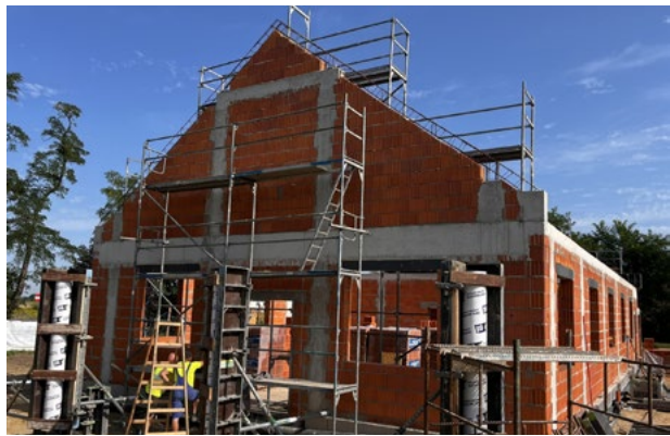
Świetlica wiejska w Sadkowie

Zadanie dofinansowane w kwocie 2 302 193,10 PLN ze środków Funduszy Europejskich dla Dolnego Śląska 2021 - 2027 (ZIT WroF) w ramach Priorytetu nr 6 „Fundusze Europejskie bliżej mieszkańców Dolnego Śląska” Działania nr 6.1 „Rozwój lokalny - strategię ZIT” Programu Fundusze Europejskie dla Dolnego Śląska 2021–2027.