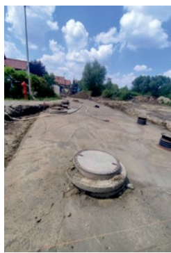
Szczęśliwa w Pietrzykowicach

Prace związane z budową nowej drogi rozpoczęły się również na ulicy Radarowej w Kębłowicach. Obecnie trwają prace ziemne. Wykonawca przystąpił do usuwania kolizji energetycznych, a także do etapowego wykonywania stabilizacji pod przyszłą nawierzchnię bitumiczną. Zadanie dotyczące budowy drogi zostało połączone z budową oświetlenia ulicznego.