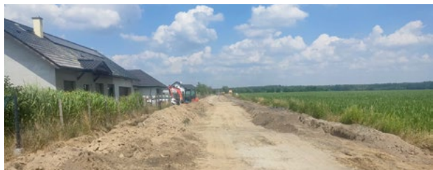
Radarowa w Kębłowicach

Rozpoczęły się już prace ziemne związane z budową drogi przy ul. Szczęśliwej w Pietrzykowicach. Aktualnie wykonywana jest sieć kanalizacji burzowej, która ma zapewnić prawidłowy sposób odprowadzenia wód deszczowych