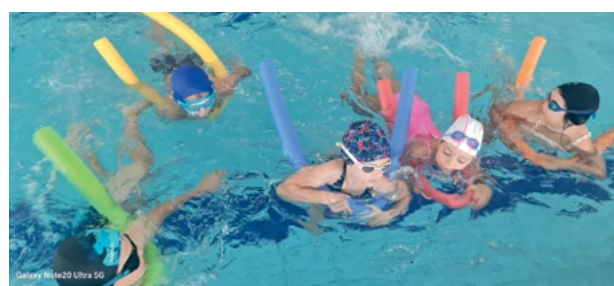
Kreatywne półkolonie

Wszystkie grupy uczestniczyły w spotkaniu o tematyce podróżniczo-muzycznej „W rytmie Ziemi”. Nasi koloniści interaktywnie zapoznali się z instrumentami oraz wzięli udział w rytmicznych animacjach i poznali tradycyjny afrykański rytm Djole. Przy okazji warsztatów dzieci uczyły się podstaw rytmiki i techniki gry na bębnach. Oprócz treści muzycznej pojawiały się opowieści o różnych kontynentach, z których to prowadzący posiada zbiór rozmaitych, ciekawych i egzotycznych instrumentów.