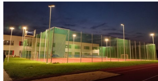
Odbiór oświetlenia boiska zewnętrznego

Z końcem czerwca zakończone zostały prace związane z budową Zespołu Szkolno-Przedszkolnego w Krzeptowie największej inwestycji w historii gminy. Aktualnie trwa procedura odbiorowa, w ramach której Wykonawca robót dokonuje czynności poprawkowych i porządkowych na nowo wybudowanym obiekcie. Placówka ma ruszyć zgodnie z planem na początek roku szkolnego 2024/2025. Wartość wykonanych robót wyniosła 58 994 656,59 zł brutto. Ponadto Wykonawcy robót wypłacona została waloryzacja wynagrodzenia za wykonane roboty budowlane w łącznej kwocie 3 289 923,54 zł brutto.