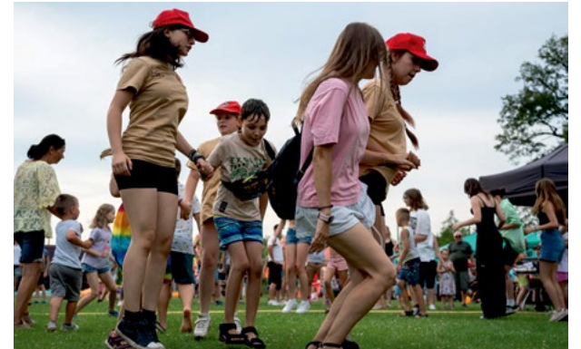
fol. GOKiS Smolec