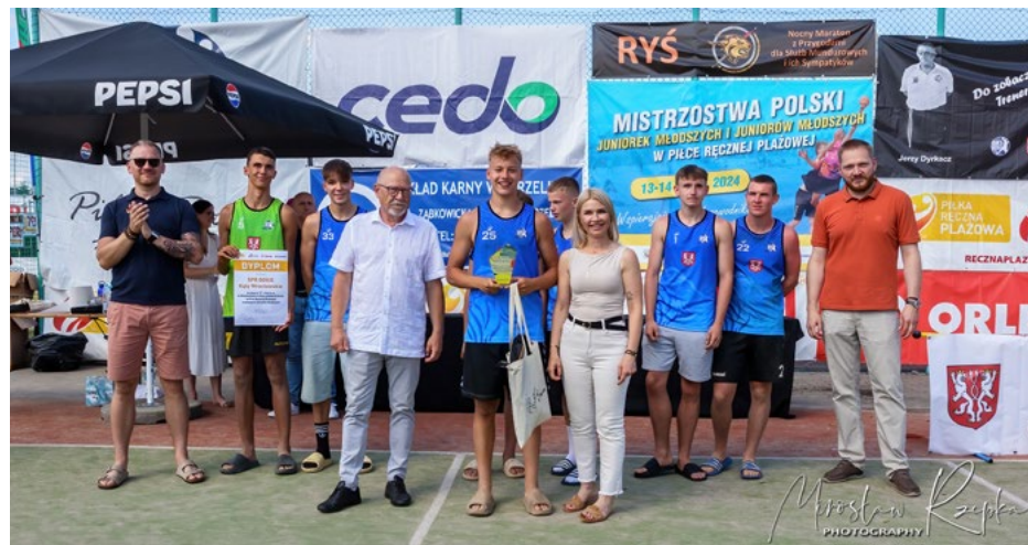
Burmistrz oraz Zastępca Burmistrza wraz z zawodnikami SPR Purina Kąty Wrocławskie