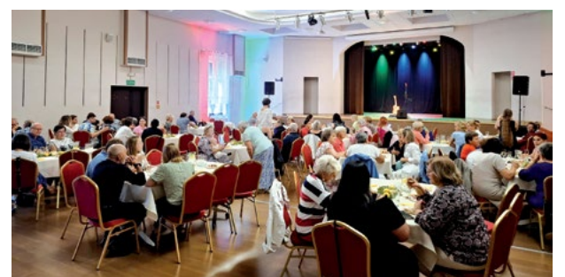
Włoska uczta

Po koncercie można było zakupić płytę muzyka i tym samym zabrać do domu odrobinę włoskiego klimatu. Kulinarne goście mieli okazję spróbować Vitello Tonnato, Caponate, Caprese oraz Grissini z Prosciutto. W wydarzeniu udział wzięło 90 osób.