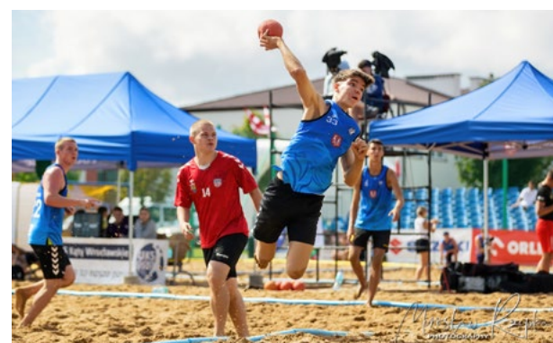
Zacięta walka kąckiej drużyny

MKS Brodnica, która w emocjonującym finale pokonała KPR Feniks Lubliniec. W rywalizacji mężczyzn triumfowała natomiast ekipa MKS Mazur Sierpc, która w finale pokonała swoich przeciwników, pokazując doskonałe przygotowanie i determinację. Ten widowiskowy i pełny sportowych emocji turniej przyciągnął nie tylko miłośników piłki ręcznej, ale także całe rodziny, dzięki licznym atrakcjom towarzyszącym zawodom. Wśród dodatkowych aktywności znalazły się konkursy, takie jak „Jaka to melodia” oraz konkurs fotograficzny na najlepsze zdjęcie wykonane na piasku. Patronami turnieju była Burmistrz Miasta i Gminy Kąty Wrocławskie oraz Wójt Gminy Kobierzyce. Dziękujemy wszystkim uczestnikom i sponsorom za stworzenie fan-