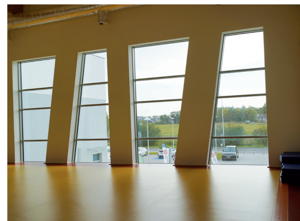
Mała sala gimnastyczna