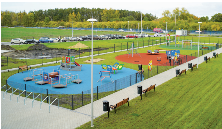
Plac zabaw dzieci przedszkolnych

Zespół Szkolno-Przedszkolny w Krzeptowie to placówka przeznaczona dla 650 dzieci szkolnych, 50 podopiecznych w dwóch oddziałach przedszkolnych tzw. „zerówkach” oraz 144 przedszkolaków w 6 oddziałach przedszkolnych z wydzielonymi osobnymi obszarami dla części szkolnej i przedszkolnej. Cały obiekt położony jest na blisko 10 000 mkw i składa się on z części szkolnej, przedszkolnej, wspólnej oraz bloku sportowego i terenu rekreacyjnego dla najmłodszych. Zajęcia lekcyjne prowadzone są w 30 nowoczesnie wyposażonych salach lekcyjnych z tablicami interaktywnymi, w tym sali chemicznej z dygestorium – specjalnym laboratorium umożliwiającym bezpieczne przeprowadzanie doświadczeń, a w przerwach uczniowie skorzystają mogą z chwili wyciszenia i relaksu z kolegami w specjalnie przygotowanym do tego obszarze ciszy tzw. foyer. Do użytku uczniów udostępniona jest również nowa biblioteka z czytelnią i elektronicznym systemem kart biblioteczkowych, aula, mała sala gimnastyczna, trzy świetlice. W budynku znajduje się również przestronny, duży blok sportowy z salą gimnastyczną z pełnowymiarowym boiskiem do piłki ręcznej z możliwością jego podziału