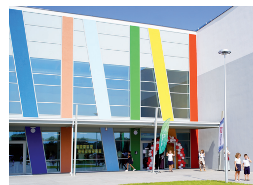
Główne wejście do szkoły

wiona została portiernia oraz szatnie dla uczniów. W części przedszkolnej budynku znajduje się 6 sal z osobną łazienką i wyjściem na wydzielony dla danego oddziału taras. Sale przedszkolne wyposażone są w ogrzewanie podłogowe. Na parterze budynku zlokalizowana jest również kuchnia wraz z zapleczem oraz dwiema jadalniami – osobno dla dzieci szkolnych i przedszkolnych. Kuchnia wyposażona jest w wysokiej jakości sprzęt kuchenny marki Retigo, w tym innowacyjne piecze konwekcyjno-parowe. Na zewnątrz zbudowane zostały dwa boiska, 100-metrowa bieżnia oraz place zabaw dostosowane do poszczególnych grup wiekowych dzieci przedszkolnych.