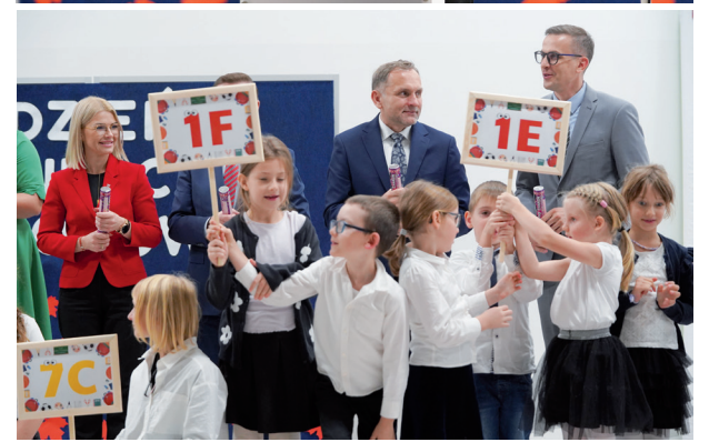
Symboliczny moment otwarcia nowej placówki