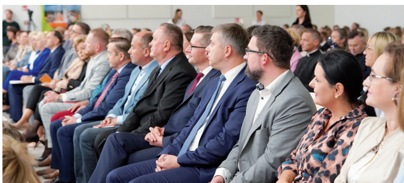
W wydarzeniu udział wzięli burmistrzowie poprzednich kadencji