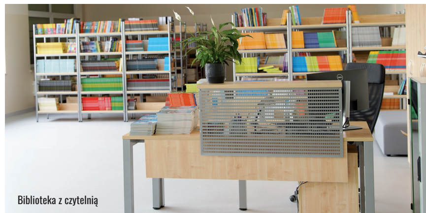
Biblioteka z czytelnią

Szkolno – Przedszkolnego w Krzeptowie – wyposażenie zaplecza kuchennego, ze środków Stowarzyszenia Aglomeracja Wrocławska.