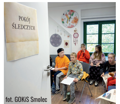
fol. GOKiS Smolec