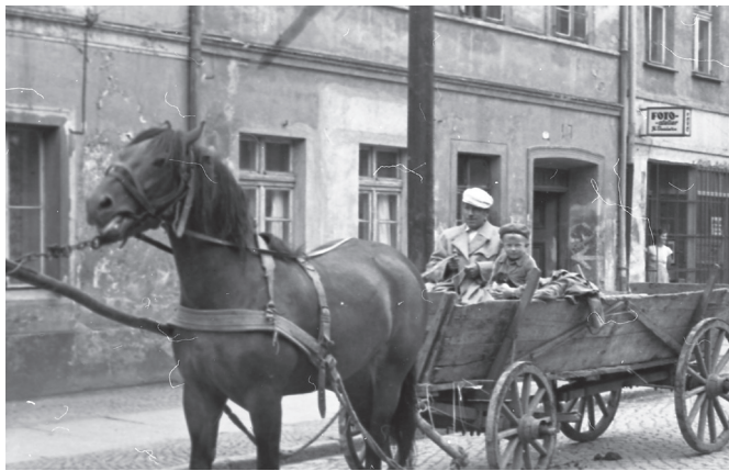
Ulica Świdnicka w latach 50.-60. po przebudowie