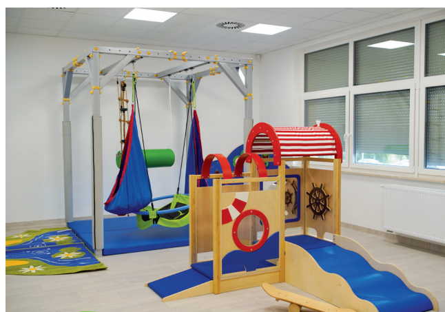
Sala do terapii integracji sensorycznej

Narodowy Fundusz Ochrony Środowiska i Gospodarki Wodnej