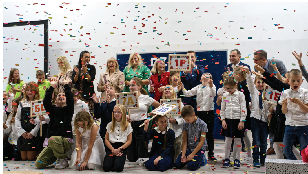
Symboliczny moment otwarcia nowej placówki

ników urzędu Wydziału Planowania i Realizacji Inwestycji, którzy z ogromnym zaangażowaniem pilnowali właściwej realizacji każdego etapu, a także Dyrektor Zespołu Obsługi Jednostek Oświatowych za sprawne przeprowadzenie rekrutacji i uruchomienie placówki. Punktem