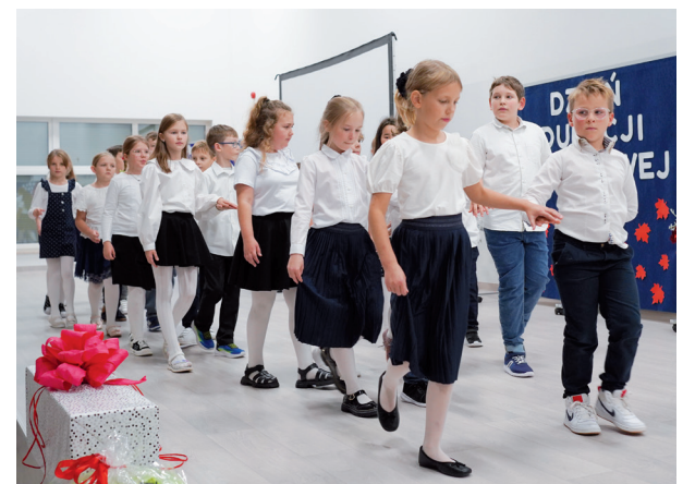
Uroczysty polonez w wykonaniu najmłodszych