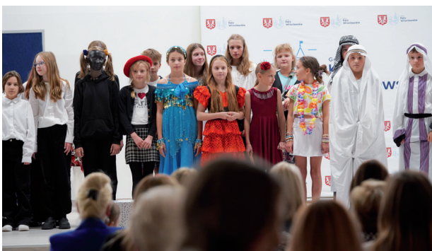
Etuidy przygotowana przez uczniów najstarszych klas