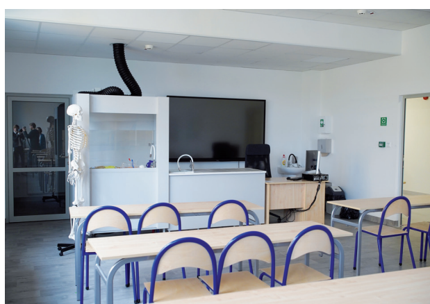
Sala chemiczna z dygestorium