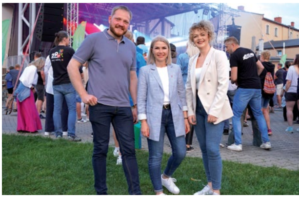
Burmistrz wraz z zastępcami podczas obchodów Dni Kątów Wrocławskich