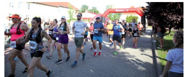
Uczestnicy Smoleckiej (za)Dyszki

Kategoria Mieszkańcy Gminy Kąty Wrocławskie: