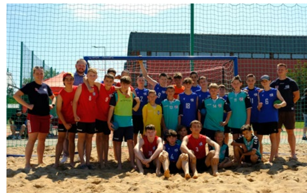
Młodzicy SPR Purina Kąty Wrocławskie

Turniej Finałowy Pucharu ZPRP Młodzików odbył się w Tarnowie w terminie od 30 maja do 2 czerwca 2024 roku. Po zakończeniu rozgrywek na szczeblu wojewódzkim 32 najlepsze drużyny w Polsce w kategorii młodzików przystąpiły do walki o Puchar ZPRP. Pierwszym etapem zmagania była runda 1/16 finału, w ramach której rozegrano osiem turniejów eliminacyjnych. Zwycięzcy każdego z turniejów wywalczyli awans do najlepszej "ósemki" w kraju. Nasz zespół zajął 1 miejsce w turnieju ćwierćfinałowym w Świebodzinie.