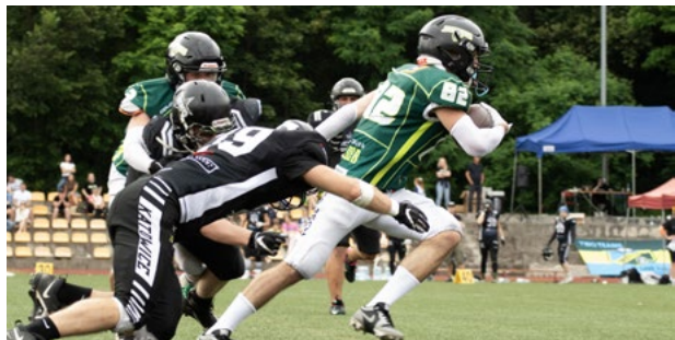
Sportowych emocji nie brakowało

Co prawda drużyna Jaguars Kąty Wrocławskie miała bardzo ambitne plany przejścia do fazy play off, jednak ciężki sezon i sytuacja sportowa z pewnością nie przeszkodziły w tym, aby z wielką pompą zakończyć sezon 2024 w Polskiej Futbol Lidze. Zawodnicy Jaguars Kąty Wrocławskie dołożyli wszelkich