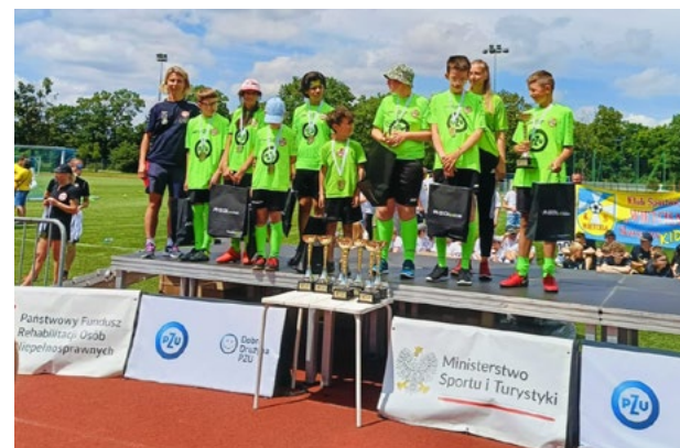
Zawodnicy Akademii GOKIS Kąty Wrocławskie na podium fot. arch. klubu

Akademia GOKIS Kąty Wrocławskie wraz z innymi akademiami wzięła udział w ogólnopolskim turnieju PZU FUTBOL PLUS. Turniej odbył się w Poznaniu pod nazwą "Tygrysy Euro", gdzie zjechało ponad 200 zawodników. Niezliczona ilość akcji, dużo pięknych bramek, ale co najważniejsze uśmiechy na twarzach dzieci towarzyszące im przez cały turniej. W rozgrywkach udział wzięły zespoły: Dynamit Elk, Futbolowa Banda, Sprawne Smoki Gorlice, Akademia GOKIS Kąty Wrocławskie, Klimontowianka Klimontów, Sekcja Futsal KGKN Gdynia, Wietcisa Skarszewy KIDS, Football Up Wrocław, Akademia Odkrywców Sportu UMCS Lublin, AP Kontra Przeclaw, Tygrysy Poznań.