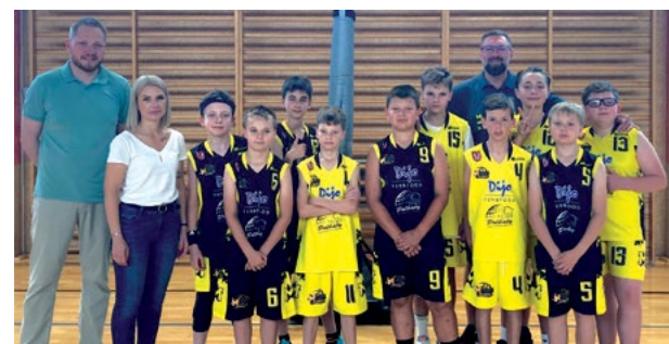
Zakończenie Dziecięcej Basket Ligi