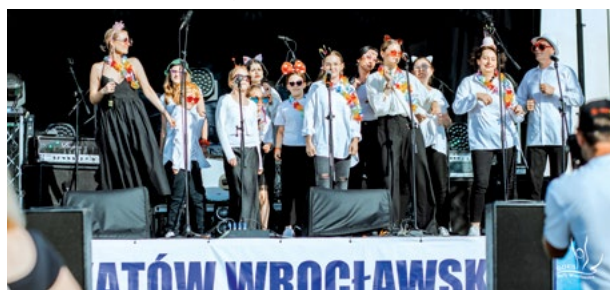
Występ Limmia Music