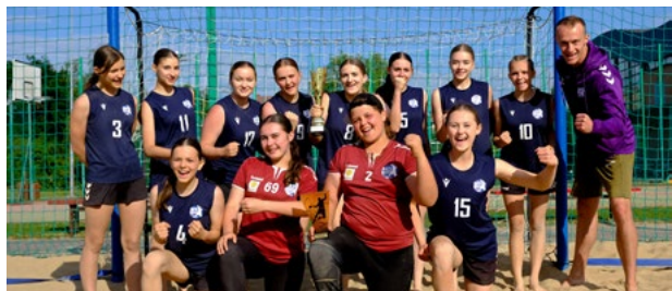
Finalistki Mistrzostw Dolnego Śląska

6 czerwca 2024 na naszych boiskach plażowych odbyły się Mistrzostwa Dolnego Śląska w Piłce Ręcznej Plażowej, podczas których klub SPR Purina Kąty Wrocławskie zdobył aż 5 medali oraz dwa tytuły Mistrza Dolnego Śląska. Zespoły młodziczek i młodzików uzyskały awans do turniejów półfinałowych. Półfinały, które zostały rozegrane 13.06.2024 wyłoniły trzy drużyny awansujące do ścisłego finału. Dziewczeta z SPR Purina Kąty Wrocławskie wraz z KPR Gminy Kobierzyce i Grunwaldem Ruda Śląska uzyskały prawo gry w turnieju finałowym.