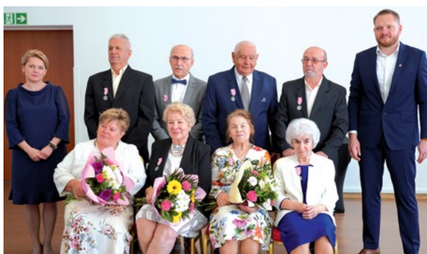
Wszystkim Jubilatam życzymy wielu wspólnych lat życia w zdrowiu i radości.