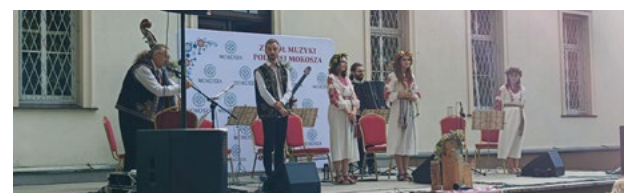
Noc Kupały z MOKOSZĄ

ostatnie miesiące. Występy na żywo, wystawy prac i stanowisko szachowe wywołały podziw i dużo radości. Dmuchańce, malowanie twarzy, słodkości i grill rodzinny umiliły dodatkowo wspólnie spędzony czas, a korytarze ośrodka wypełniały uśmiechnięte twarze. Dziękujemy za obecność i aktywny udział. Czekamy na Wasz powrót we wrześniu.