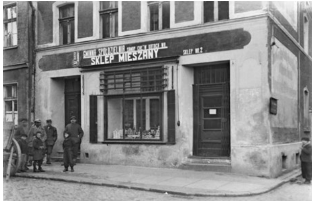
Kamienica przy Sikorskiego 2 w lata 40.-50

1 listopada 1931 r. na świat przyszła tu Dorothea Walda, zwana pieszczotliwie Dorchen, lubiana i popularna niemiecka aktorka, która grała też m.in. u Andrzeja Wajdy. Przez całe życie działała na rzecz przesiedleńców i kontynuowania pamięci o rodzinnym mieście. Na Śląsk wraca-