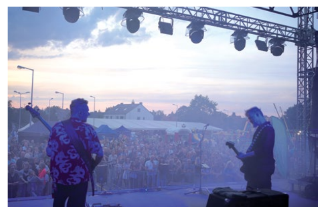
Koncert Organek zgromadził tłumy