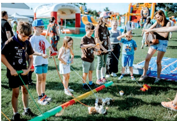
Zabawy i konkursy dla najmłodszych