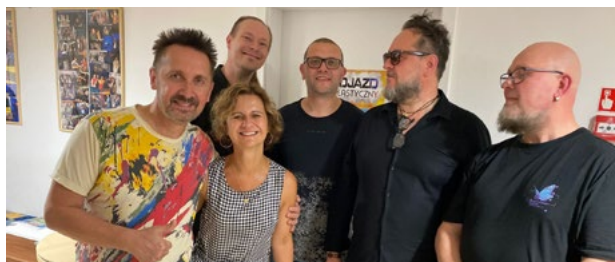
GOLDEN LIFE świętuje swój jubileusz w GOKIS Smolec

Niezapomniany wieczór w Smolcu. 14 czerwca odbył się pierwszy klubowy koncert, w ramach największej jubileuszowej trasy w historii zespołu Golden Life – „Oprócz błękitnego nieba”. Publiczność była zachwycona energią, jaką muzycy wnieśli na scenę, a hity zespołu takie jak „Oprócz błękitnego nieba” i „Helikopter” porwały wszystkich do wspólnego śpiewania. Smolec stał się miejscem, gdzie fani zespołu mogli na nowo poczuć magię muzyki zespołu Golden Life. To była prawdziwa uczta dla duszy i serca. Dziękujemy, że byliście z nami.