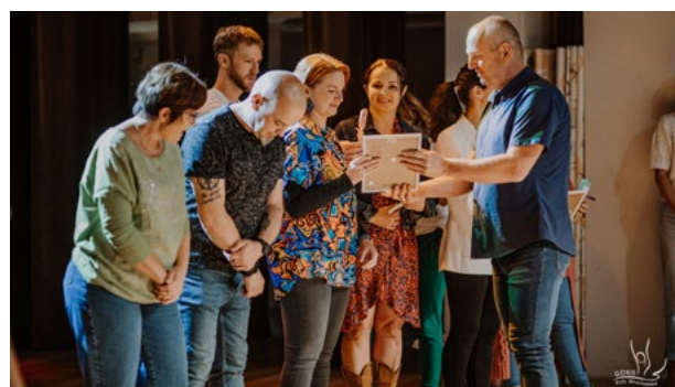
Zakończenie roku kulturalnego GOKIS

ostatnie miesiące. Występy na żywo, wystawy prac i stanowisko szachowe wywołały podziw i dużo radości. Dmuchańce, malowanie twarzy, słodkości i grill rodzinny umiliły dodatkowo wspólnie spędzony czas, a korytarze ośrodka wypełniały uśmiechnięte twarze. Dziękujemy za obecność i aktywny udział. Czekamy na Wasz powrót we wrześniu.