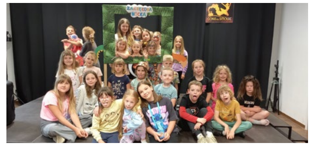
Dzień dziecka w GOKIS Smolec

ły mnóstwo uśmiechów. O godzinie 17 dzieci miały okazję obejrzeć spektakl teatru Regeneracja pt. „Przygody Świnki Paulinki”. Dostarczył on małym widzom mnóstwo emocji i śmiechu. Kulminacją dnia była Zakrecona Nocka. W programie znalazła się gra terenowa „Kopiec czy Dziupła”, wytwórnia teledysków oraz dworcowe kino. Dzień Dziecka z ogonkiem dostarczył najmłodszym mnóstwo radości i niezapomnianych wspomnień.