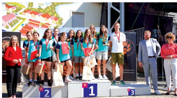
Zawodniczki SPR Purina Kąty Wrocławskie