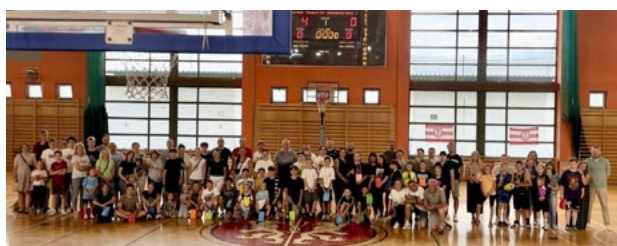
Zakończenie sezonu koszykarskiego

Zakończenie sezonu koszykarskiego w Kątach Wrocławskich to było niezapomniane wydarzenie! Dzieci i rodzice spotkali się, aby wspólnie świętować miniony rok pełen sportowych emocji i osiągnięć. Były animacje, wspólne zabawy i sportowa rywalizacja, która dostarczyła mnóstwo radości. Wszyscy mieli okazję wziąć udział w różnych konkurencjach, a uśmiechy na twarzach dzieci i rodziców były najlepszym dowodem na to, jak wspaniale się bawili. Dziękujemy wszystkim za udział i nie możemy się doczekać kolejnego sezonu pełnego koszykarskich wyzwań z Maximusem!