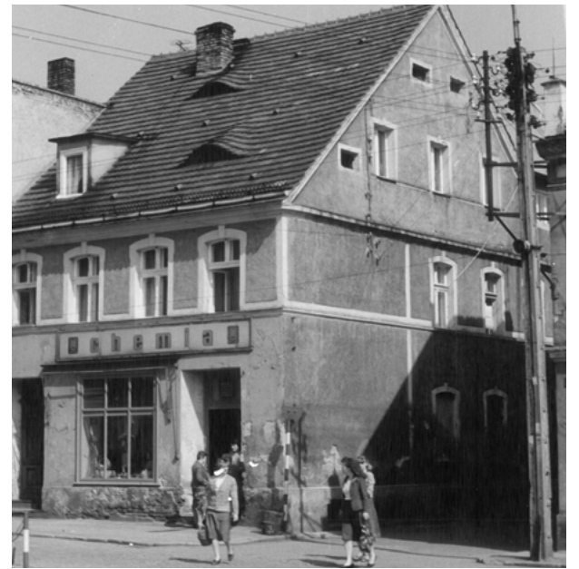
Kamienica przy Sikorskiego 2 ok. roku 1986

Na początku działała tu spółdzielnia ogólnospożywcza „Tęcza”, następnie swoje sklepy prowadził GS, najbardziej znany był chyba sklep z chemią, który przetrwał do lat 90. Młodszy mieszkańcy wiążą to miejsce z działa-