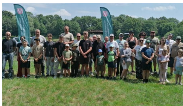
Młodzi adeptki sztuki wędkowania