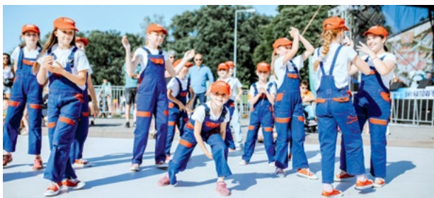
Pokaz tańca zespołu Maska