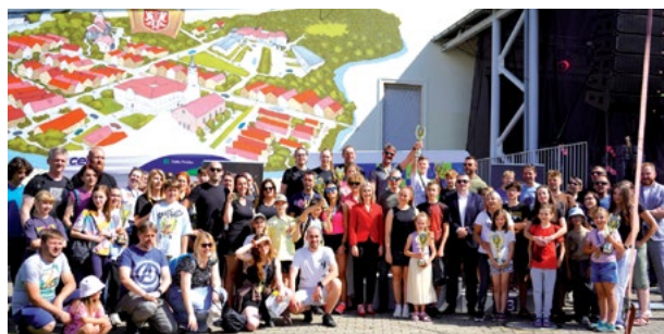
Uczestnicy Maratonu Rodzinnego RYŚ