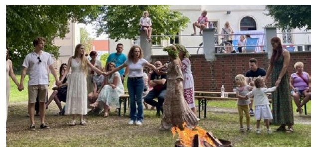
Noc Kupały z MOKOSZĄ

Noc Kupały, zwana również nocą świętojańską, to pradawne święto słowiańskie związane z letnim przesileniem, które obchodzone jest w najkrótszą noc w roku. Starosłowiańskie obrzędy i tradycje poznać mogli również mieszkańcy naszej gminy, a wszystko dzięki Zespołowi Muzyki Polskiej MOKOSZA, który 23 czerwca z tej okazji przygotował niezwykle koncert. Nie mogło zabraknąć również tańców przy ognisku. Uczestnicy mieli także możliwość zwiedzić podziemia GOKIS Kąty Wrocławskie. Serdecznie dziękujemy wszystkim za udział i wspólną zabawę.