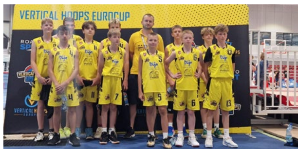
Maximusi w międzynarodowym turnieju

W dniach 7-9 czerwca nasi młodzi koszykarze wzięli udział w niesamowitym wydarzeniu, które na zawsze zostanie w ich pamięci. Drużyna Maximusa rywalizowała w słynnym turnieju Vertical Hoops z zespołami z La Meute (Francja), Prievdza (Litwa), Warszawy (Legia), Wrocławia (WKS Śląsk oraz AK Orły) i Jeleniej Góry. Było to dla naszego zespołu niezwykle przeżycie, pełne emocji i wyzwania. Chłopcy pokazali ogromną determinację i zaangażowanie na parkiecie. Mimo trudności, jakie napotkali, nie poddali się i walczyli do ostatniego gwizdka. Ten turniej nie tylko wzbogacił ich o nowe doświadczenia, ale i umocnił ducha drużyny. Jesteśmy z nich bardzo dumni i już nie możemy doczekać się kolejnych sportowych zmagania na arenie międzynarodowej! Gratulacje Maximus!