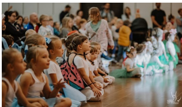
Zakończenie roku kulturalnego GOKIS

13 czerwca hucznie zakończyliśmy również rok kulturalny 2023/2024 w Gminnym Ośrodku Kultury i Sportu. Artystyczna Fantazja kolejny raz poniosła uczestników zajęć GOKIS Kąty Wrocławskie, którzy mogli publicznie zaprezentować swoje postępy i umiejętności zdobywane przez