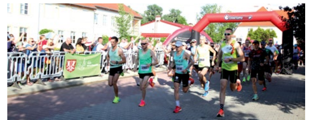
Uczestnicy Smoleckiej (za)Dyszki_fot. S.Francuz Omega Sport