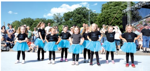
Występy artystyczne najmłodszych