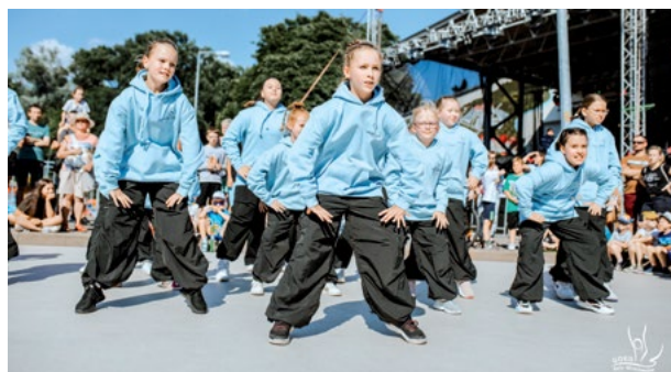
Występ ekipy Your Space