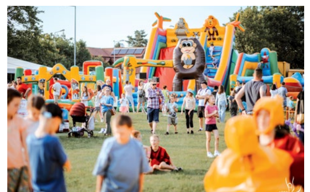
Mnóstwo atrakcji dla całych rodzin