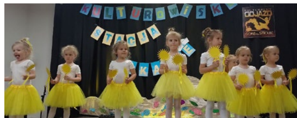
Kulturowisko dopływa do stacji wakacje

Z radością dzielimy się wspomnieniami z niedawnego zakończenia roku kulturalnego, które miało miejsce 15 czerwca w GOKIS Smolec. To był niezwykle dzień, pełen fantastycznych atrakcji dla wszystkich uczestników. Występy artystyczne na scenie i pod chmurką, warsztaty, wystawy, gry podwórkowe XXL, piana party i wiele, wiele innych. Było to z pewnością godne podsumowanie rocznej działalności. Dziękujemy wszystkim, którzy dołączyli do naszego wydarzenia i uczynili je tak wyjątkowym.