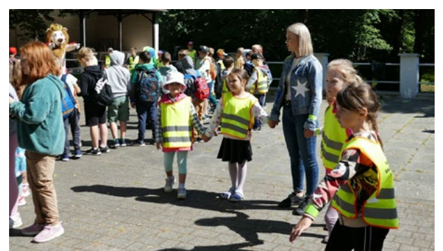
Gminny Dzień Dziecka