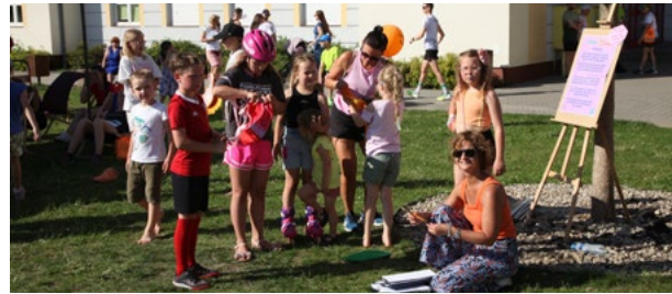
Smolecka (za)dyszka dla najmłodszych fot. Olimpia Sport

Pracownicy filii GOKIS w Smolcu wykazali się dużym wsparciem organizacyjnym podczas największej imprezy biegowej w gminie jaką jest Smolecka (za)dyszka. 8 czerwca na parking przy szkole w Smolcu podczas Smoleckiej (za)dyszki odbyła się gra podwórkowa „Trawa to lawa” zorganizowana właśnie przez GOKIS Smolec. Gra była podzielona na kategorie wiekowe, co umożliwiło każdemu dziecku udział w rywalizacji dostosowanej do jego możliwości. Dzieci miały za zadanie przeskakiwać po wyznaczonych ścieżkach, unikając „lawy” i starając się dotrzeć do bezpieczne-