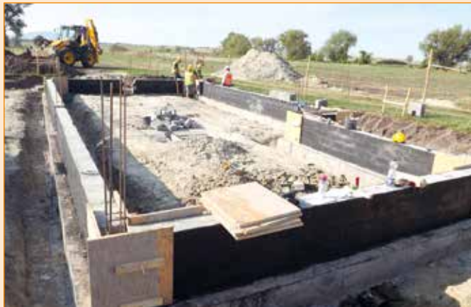
Fundamenty świetlicy wiejskiej w Kilianowie.

Trwają prace przy budowie nowych świetlic wiejskich w miejscowościach Kilianów, Kębłowice i Pełcznica. Termin zakończenia prac w przyszłym roku.